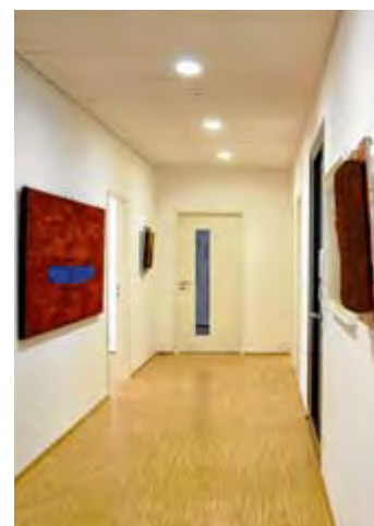
Blick in die neuen Räume.